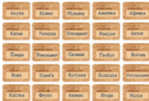
картки зі словами